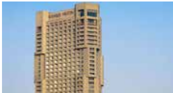
Ramses Hilton | ★★★★★

Ubicado en el corazón de El Cairo, este hotel ofrece fácil acceso a las principales atracciones, como el Museo Egipcio. Sus habitaciones cuentan con balcones privados con vistas al Nilo o a la ciudad. Además, el hotel dispone de restaurantes internacionales y una piscina al aire libre.