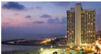
Renaissance Tel Aviv Hotel | ★★★★★

Ubicado junto a la laguna de Eilat, este hotel familiar ofrece amplias habitaciones con vistas al Mar Rojo o a la ciudad. Cuenta con una gran piscina, un spa de lujo y actividades para todas las edades, ideal para unas vacaciones inolvidables.