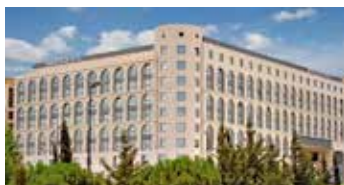
Grand Court Jerusalem Hotel | ★★★★★

Ubicado en lo alto de una montaña en Galilea, este hotel Glatt-Kosher es ideal para viajeros religiosos. En un entorno tranquilo fuera de la ciudad y a pocos minutos de Tiberías, podrás disfrutar de impresionantes vistas panorámicas de las montañas. Además, el hotel cuenta con internet inalámbrico gratuito para sus huéspedes.