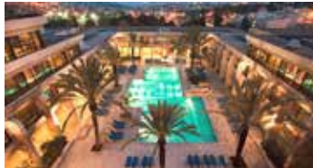
Dan Jerusalem Hotel | ★★★★★

Ubicado en lo alto de una montaña en Galilea, este hotel Glatt-Kosher es ideal para viajeros religiosos. En un entorno tranquilo fuera de la ciudad y a pocos minutos de Tiberías, podrás disfrutar de impresionantes vistas panorámicas de las montañas. Además, el hotel cuenta con internet inalámbrico gratuito para sus huéspedes.