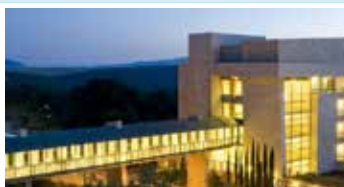
Kibbutz Hotel Lavi - Superior | ★★★★★

Situado en una ubicación privilegiada en el corazón de Tel Aviv, el Grand Beach Hotel ofrece 212 espaciales habitaciones con un elegante diseño urbano. Disfrute de las hermosas playas de Tel Aviv, a solo unos minutos del emocionante mercado de Carmel, restaurantes y cafeterías de prestigio, clubes y bares, centros comerciales y culturales.