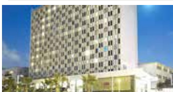
Grand Beach Tel Aviv Hotel | ★★★★★

Este tranquilo hotel, ideal para amantes del buceo, se encuentra cerca del famoso arrecife de coral de Eilat. Ofrece cómodas habitaciones, una gran piscina y acceso a actividades acuáticas, perfecto para unas vacaciones relajantes junto al Mar Rojo.