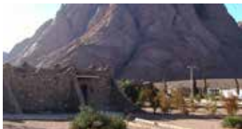
Wadi El Raha | ★★★★★

Este moderno hotel combina comodidad y estilo, con vistas panorámicas de la ciudad y proximidad a las icónicas Pirámides de Giza. Ofrece habitaciones elegantes, restaurantes internacionales y una piscina al aire libre, perfecto para explorar el fascinante Egipto.