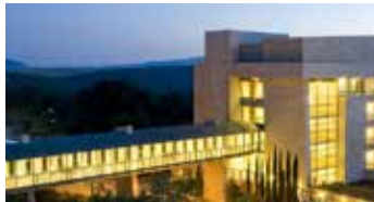
Kibbutz Hotel Lavi - De Lujo | ★★★★★

Situado frente a la playa, este elegante hotel ofrece acceso directo al paseo marítimo de Tel Aviv. Sus habitaciones tienen vistas al mar o a la ciudad, y el hotel cuenta con restaurantes internacionales, un spa, y una piscina cubierta para el máximo confort.