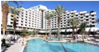
Isrotel King Solomon Eilat | ★★★★★

Ubicado cerca del histórico Monte Sinaí, este acogedor hotel es perfecto para peregrinos y viajeros. Ofrece habitaciones cómodas con vistas al desierto, un restaurante con deliciosa cocina local y un ambiente sereno para disfrutar de una estancia inolvidable.