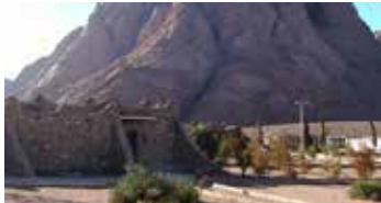
Wadi El Raha | ★★★★★

Ubicado en el corazón de El Cairo, este hotel ofrece fácil acceso a las principales atracciones, como el Museo Egipcio. Sus habitaciones cuentan con balcones privados con vistas al Nilo o a la ciudad. Además, el hotel dispone de restaurantes internacionales y una piscina al aire libre.