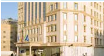
Barceló Cairo Pyramids | ★★★★★

Este moderno hotel combina comodidad y estilo, con vistas panorámicas de la ciudad y proximidad a las icónicas Pirámides de Giza. Ofrece habitaciones elegantes, restaurantes internacionales y una piscina al aire libre, perfecto para explorar el fascinante Egipto.