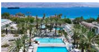
Isrotel Yam Suf | ★★★★★

Ubicado cerca del histórico Monte Sinaí, este acogedor hotel es perfecto para peregrinos y viajeros. Ofrece habitaciones cómodas con vistas al desierto, un restaurante con deliciosa cocina local y un ambiente sereno para disfrutar de una estancia inolvidable.